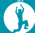
ONDERNEMER SPORT & HEALTH